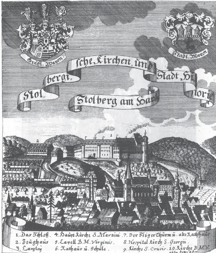
Stolberg am Harz. Aus: Zeitfuchs, Stolbergische Kirchen- und Stadthistorie (1717).